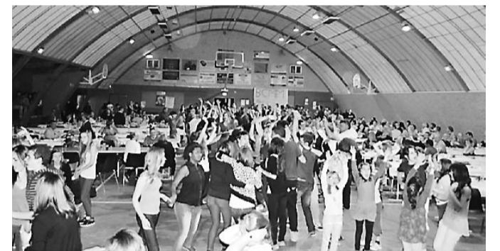
Les 18 et 19 mai, Grande Fête du BCMM.